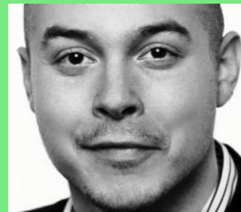
MSc. Psychologie 2. Semester

„80 Prozent der Resultate werden aus den 20 Prozent der Ursachen abgeleitet.“ Vilfredo F. Pareto (1848 - 1923)