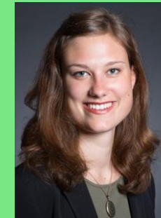
BSc. Psychologie, 6. Semester

War über eine Jahr Projektleitung bei einer Studentenorganisation