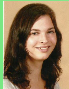
BSc. Psychologie, 2. Semester

Ich möchte im Fachschaftsrat mithelfen, das Studium für uns alle und die Jahrgänge nach uns so machbar und angenehm wie möglich zu gestalten und ich glaube, dass das mit genügend Einsatz von uns Studenten auf jeden Fall machbar ist. Ich möchte mich für unsere Interessen einsetzen, habe immer ein offenes Ohr, wenn es um Probleme mit dem Studium geht und würde das gerne produktiv umsetzen!