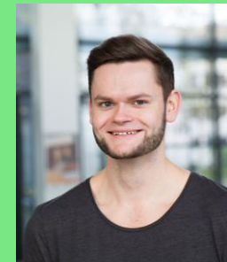
BSc. Psychologie, 6. Semester

Bereits seit 2014 Mitglied im Fachschafts- & Fakultätsrat, aktueller Sprecher für Internes