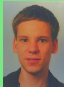
BSc. Psychologie, 4. Semester

Bereits 4 Jahre bei ver.di im Landesbezirksjugendvorstand und seit 2014 Mitglied im Fachschafts- & Fakultätsrat