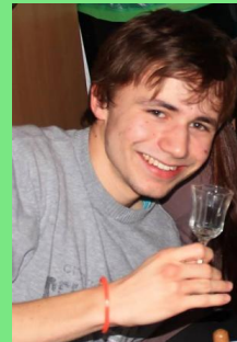
BSc. Psychologie, 2. Semester

Mein ausgeprägter Sinn für Gerechtigkeit und der Glaube daran, dass sich vieles nur gemeinsam lösen lässt, trieben mich in die Arme des FaRa FNW. Wenn ihr mich wählt, setze ich hernach Leib und Seele ein, um euch würdig zu vertreten!