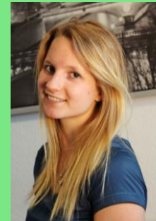
BSc. Psychologie, 2. Semester

Ich hab' einfach Lust mitzumischen und meine Meinung einzubringen. Da ich selbst vom Engagement des Fachschaftsrates profitiert habe, möchte ich nun etwas zurückgeben und helfen zukünftige Events und Programme zu organisieren. Wo Freude ist, ist auch ein Weg.