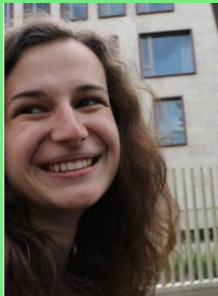
BSc. Psychologie, 4. Semester

Bereits seit 2014 Mitglied im Fachschaftsrat (Sprechstunde)