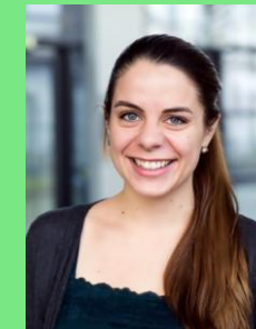
BSc. Psychologie, 4. Semester

Bereits seit 2014 Mitglied im Fachschafts- & Fakultätsrat, Sprecherin für Internes