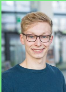
BSc. Psychologie, 4. Semester

Bereits seit 2014 Mitglied im Fachschaftsrat (Finanzprüfer)