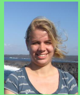
MSc. Integrative Neuroscience, 2. Semester

Ein besonderes Anliegen ist mir die Einbeziehung unserer zahlreichen ausländischen Mitstudent*innen in den akademischen Alltag unserer Universität. Ich möchte meinen persönlichen Beitrag zu gegenseitiger Verständigung sowie zum Austausch von Kenntnissen und Erfahrungen leisten, denn wir können alle voneinander lernen.