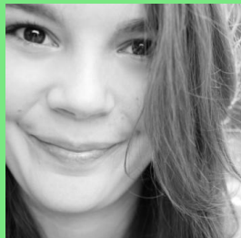
BSc. Psychologie, 2. Semester

Ich wollte schon immer mal ein bisschen die Welt retten!